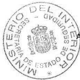
Ana María Botella Gómez